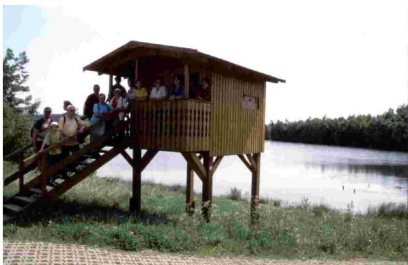
Gaststätte & Pension Zum Plothenteich

wurden. Wir wollen danach besonders auf den Rohrteich auf der anderen Straßenseite achten (Tafel). Hier wiederholt sich im allgemeinen jährlich ein Naturschauspiel, das sogenannte „Starenwunder“, wo im Herbst zum Vogelzug abends viele tausend Stare in den breiten Schilf- (Rohr-) Gürtel einfallen, um zu übernachten.