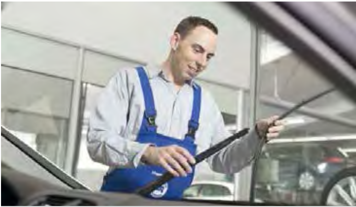
Die Wischerblätter sollten je nach Nutzungsfrequenz einmal im Jahr erneuert werden.

Der Winter ist nicht mehr weit. Es wird schon früher dunkel, nasse Straßen trocknen nur noch langsam ab und morgens behindert oft Nebel die Sicht. Höchste Zeit, die Scheibenreinigungsanlage auf Vordermann zu bringen.