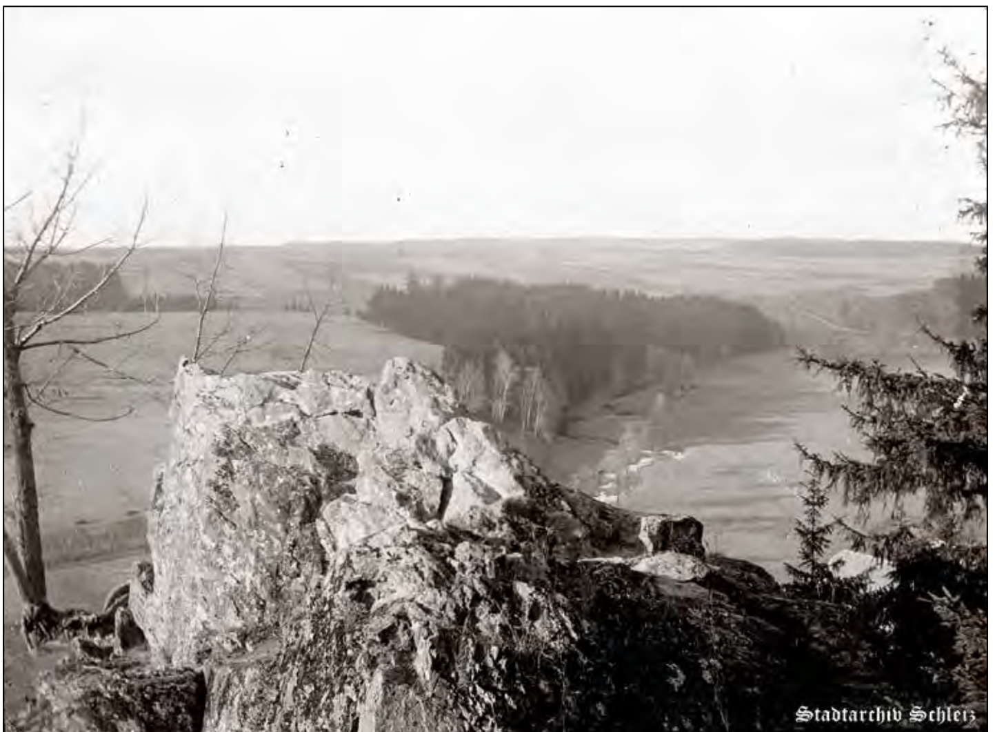
Foto: Amorfelsen bei Oschitz eines unbekanntnen Fotografen

Auch die sogenannten Buchen, die Höhe des Pulverturms, der reizende Buchenhain am kleinen Schweinsberge ließen sich mit geringen Kostenaufwände zu herrlichen Spaziergängen einrichten. So war ich, von Westen ausgehend, an der Südseite von Schleiz herumgekommen und überblickte die sonnige Oettersdorfer Höhe, wo früher der mir noch genau erinnerliche, altersgraue Galgen emporragte. Später ist aus der etwas erhöhten Stelle dicht an der Geraer Straße ein jetzt jedoch stark vernachlässigter Aussichtspunkt geschaffen worden. Man überblickt die in großartiger Lage am Schlossberge sich hinzie-