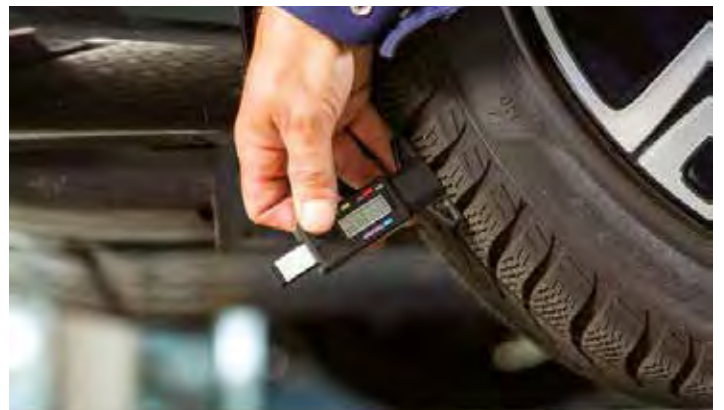
Liegt die Profiltiefe unter vier Millimetern, ist der Reifen nicht mehr für den Winter geeignet.

Und nicht vergessen: Liegt die Profiltiefe dann unter vier Millimetern, ist der Reifen nicht mehr für den Winter geeignet. Und der ist gar nicht mehr weit, denn der nächste Monat beginnt mit einem „O“ – und von O bis O, also von Oktober bis Ostern, sollte das Auto auf Winterreifen stehen. Deshalb zum Schluss der Tipp, sich rechtzeitig bei seiner Werkstatt um einen Termin zum Räderwechsel zu kümmern. Denn sobald die erste Flocke fällt, kommen auch dieses Jahr wieder alle gleichzeitig.